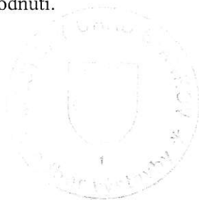
Ing. Marcela Vostracká vedoucí odboru

Rozhodnutí má podle § 93 odst. 1 stavebního zákona platnost 2 roky. Podmínky rozhodnutí o umístění stavby platí po dobu trvání stavby či zařízení, nedošlo-li z povahy věci k jejich konzumaci. Stavba nesmí být zahájena, dokud rozhodnutí nenabude právní moci. Stavební povolení pozbývá platnosti, jestliže stavba nebyla zahájena do 2 let ode dne, kdy nabylo právní moci. Toto rozhodnutí je vykonatelné po nabytí právní moci územního rozhodnutí.